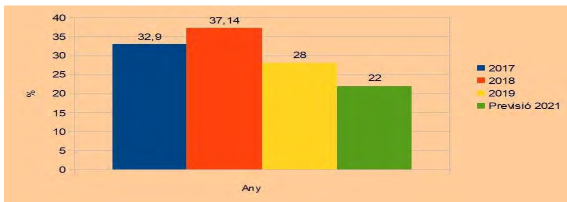
Percentatge d'interins a l'escola pública de les Illes Balears